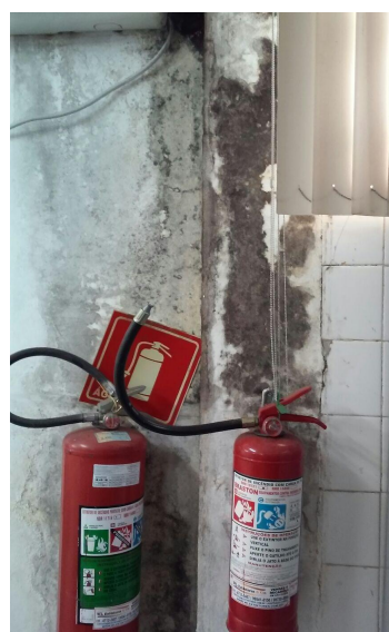
area mofada no interior ds farmácia