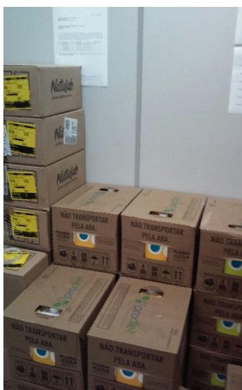
Medicamentos na parede