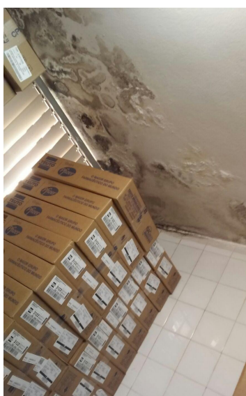
medicamentos próximos a area mofada

Comentários: Mofo e infiltrações em vários pontos da sala da farmácia.