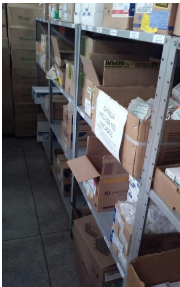
Medicamentos em caixas terciárias

Comentários: Vários medicamentos estão acondicionados nas caixas terciárias já abertas.