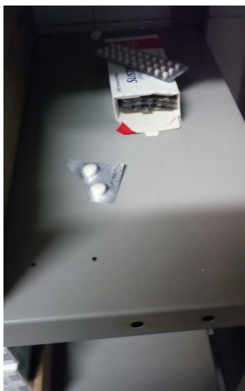
cartela de medicamento cortada

Comentários: Verificamos algumas cartelas cortadas com tesoura, o que nos parece precário.